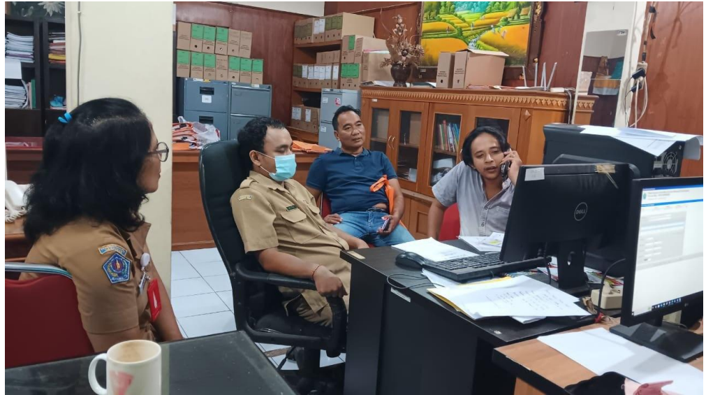
Dokumentasi dari Koperasi yang melakukan Konsultasi Pembuatan Laporan Keuangan Koperasi