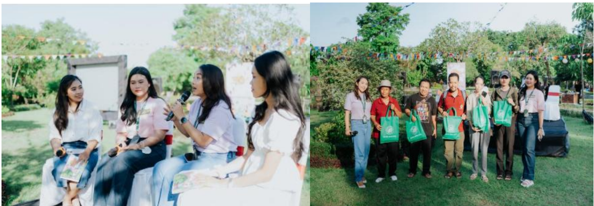
Dokumentasi Pendampingan “Literasi Keuangan bagi Pelaku UMKM di Kota Denpasar”

3) Pendampingan UMKM “Literasi Keuangan bagi Pelaku UMKM di Kota Denpasar” yang dilaksanakan pada tanggal 1 Maret 2025. Kegiatan ini dilakukan karena masih banyaknya pelaku UMKM yang sulit untuk mendapatkan akses permodalan dan kurang paham bagaimana membuat laporan keuangan sederhana. Dalam pendampingan ini melibatkan Bank Pembangunan Daerah (BPD) Bali untuk mensosialisasikan berkaitan dengan Kredit Usaha Rakyat (KUR) dan QRIS kepada 15 Pelaku UMKM yang tergabung dalam Kelompok Tani Nelayan Andalan (KTNA) Kota Denpasar. Kegiatan ini juga dilaksanakan serangkaian dengan HUT Kota Denpasar ke – 237 dengan tema “Bergerak Bersama Menuju Denpasar Maju” yang diadakan di Taman Kota Lumintang Denpasar.