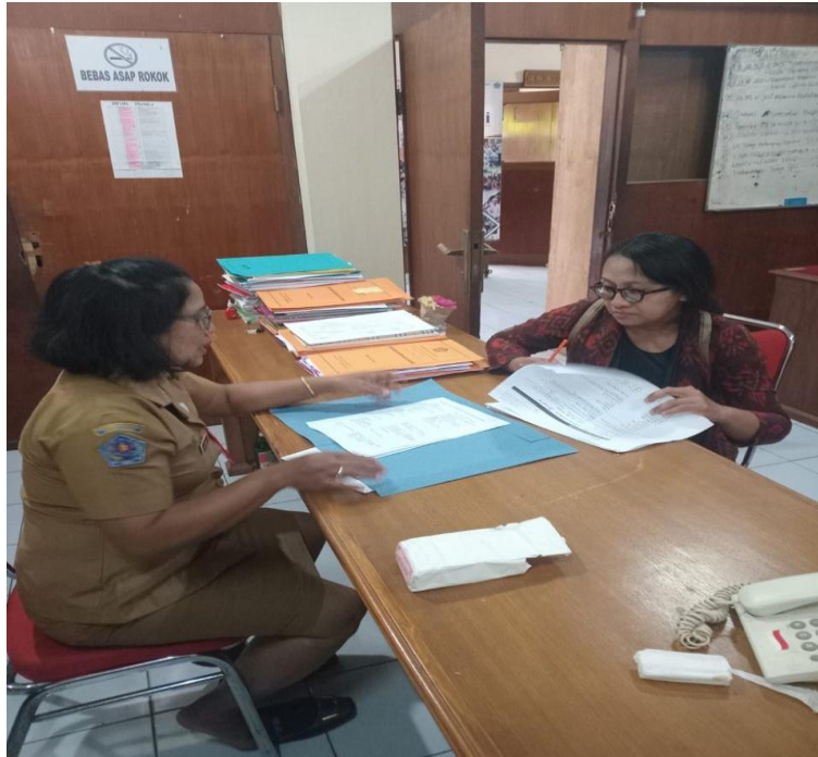
Dokumentasi dari Koperasi yang melakukan perpanjangan Nomor Induk Koperasi