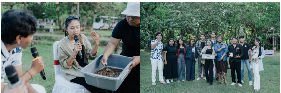
Dokumentasi Pendampingan UMKM "Magot Sebagai Solusi Penanganan Sampah dan Ide Usaha Baru"

1) Pendampingan UMKM "Magot Sebagai Solusi Penanganan Sampah dan Ide Usaha Baru" yang dilaksanakan pada tanggal 27 Februari 2025. Kegiatan ini berupa pemberian materi pengenalan magot sebagai solusi penanganan sampah dan tentunya praktek dalam pemeliharaan maggot kepada 15 Pelaku UMKM Inkubator Bisnis Universitas Ngurah Rai yang terdiri dari beragam bidang usaha. Magot adalah hewan seperti cacing berwarna kuning yang dapat memakan sisa - sisa makanan. Magot pun mudah untuk dikembangbiakan atau dirawat karena mereka hanya butuh sisa makanan. Sisa makanan yang diurai pun dapat 2 (dua) kali dari berat magot itu sendiri. Ke depannya magot akan menjadi peluang bisnis yang menjanjikan bagi pengusaha - pengusaha baru. Kegiatan ini dilaksanakan serangkaian dengan HUT Kota Denpasar ke - 237 dengan tema "Bergerak Bersama Menuju Denpasar Maju" yang diadakan di Taman Kota Lumintang Denpasar.