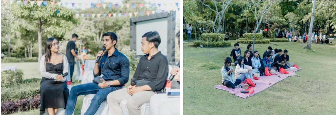
Dokumentasi Pendampingan UMKM “Membangun Jiwa Wirausaha Muda”

jiwa wirausaha. Ini menjadi pekerjaan rumah (PR) bagi Pemerintah maupun stakeholder terkait yang membidangi masalah kewirausahaan. Kegiatan ini juga dilaksanakan serangkaian dengan HUT Kota Denpasar ke – 237 dengan tema “Bergerak Bersama Menuju Denpasar Maju” yang diadakan di Taman Kota Lumintang Denpasar.