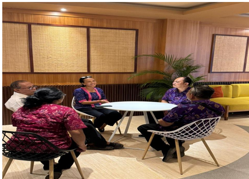
Dokumentasi dari Koperasi yang melakukan Konsultasi Perubahan Anggaran Dasar Koperasi