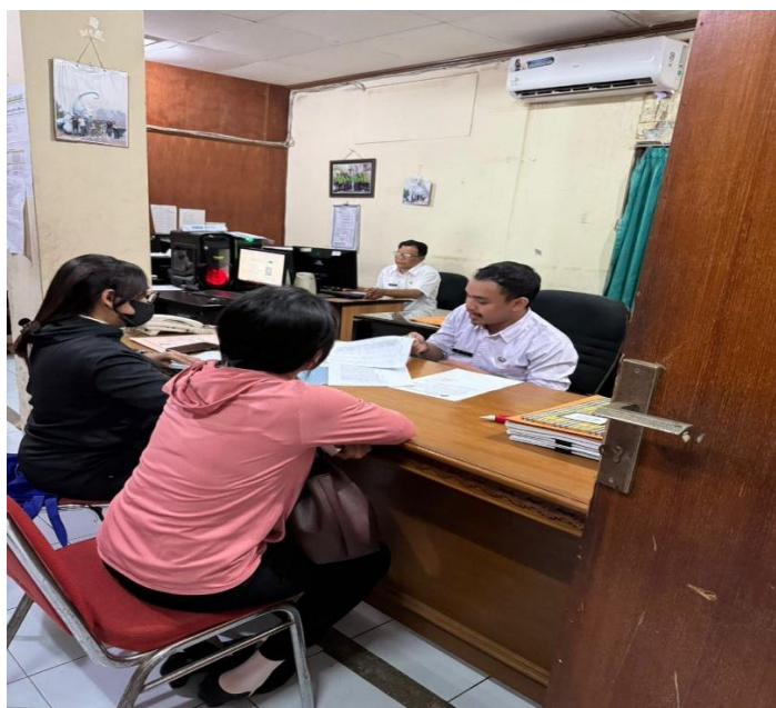
Dokumentasi dari Koperasi yang melakukan Pencetakan Sertifikat Nomor Induk Koperasi