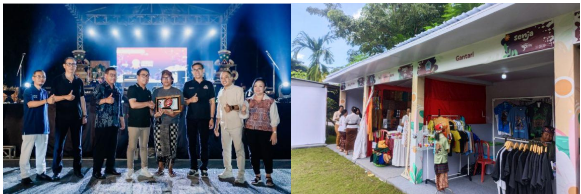
Dokumentasi kegiatan Pameran UMKM dalam rangka HUT Kota Denpasar

Penyelenggaraan Pameran UMKM dalam rangka HUT Kota Denpasar. Dalam upaya meningkatkan geliat perekonomian di Kota Denpasar serta mendorong pelaku UMKM untuk naik kelas dan untuk memeriahkan HUT Kota Denpasar ke – 237 dengan tema “Bergerak Bersama Menuju Denpasar Maju” maka diselenggarakanlah Pameran UMKM HUT Kota Denpasar ke - 237 yang bertajuk Senja di Denpasar pada tanggal 27 Februari 2025 – 1 Maret 2025 yang bertempat di Taman Kota Lumintang Denpasar. Senja memiliki kepanjangan Santai Kreatif Pameran UMKM Juara. Pameran ini merupakan ajang bagi 30 pelaku UMKM di Kota Denpasar untuk memasarkan produknya serta memperkenalkan produknya ke masyarakat luas khususnya masyarakat Kota Denpasar. Selain untuk memperkenalkan produknya, pelaku UMKM Kota Denpasar juga dapat meningkatkan omsetnya melalui pameran yang diadakan guna ikut serta memeriahkan HUT Kota Denpasar ke – 237.