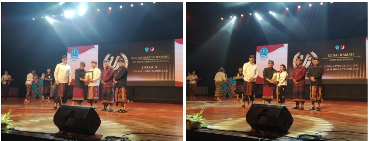
Dokumentasi kegiatan UMKM Awards