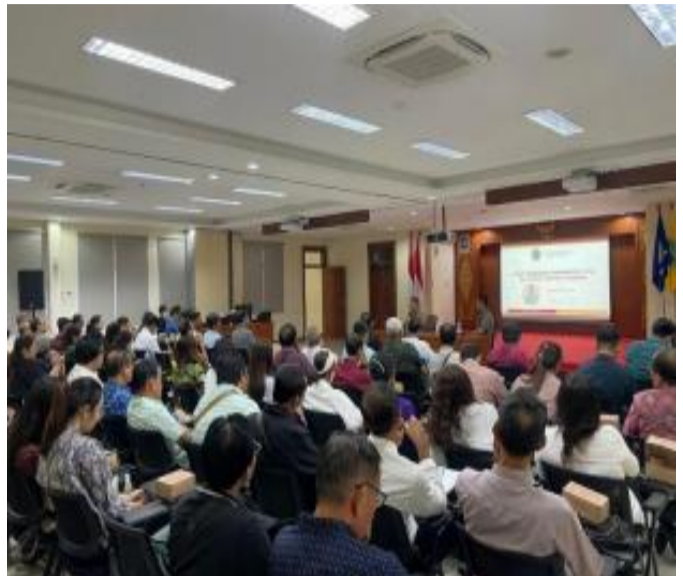
Dokumentasi Kegiatan Piloting Manajemen KIE