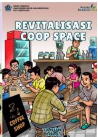
Dokumentasi Kegiatan Piloting Denpasar Coop Creative Hub