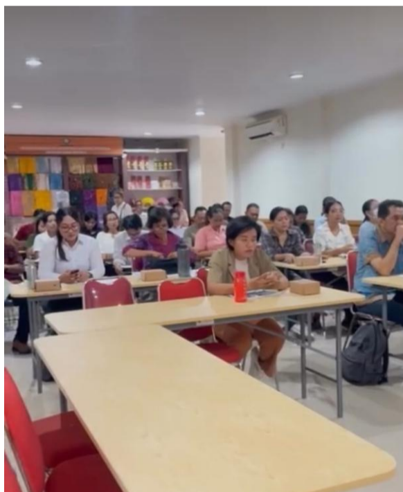
Dokumentasi Diklat Perpajakan

Pada indikator Persentase meningkat nya Omset dan Asset usaha Mikro mencapai realisasi sebesar 100% dari target yang ditetapkan sebesar 1,50% dalam hal pencapaian Persentase meningkat nya Omset dan Asset usaha Mikro, dilakukan dengan melakukan workshop dan festival yaitu :