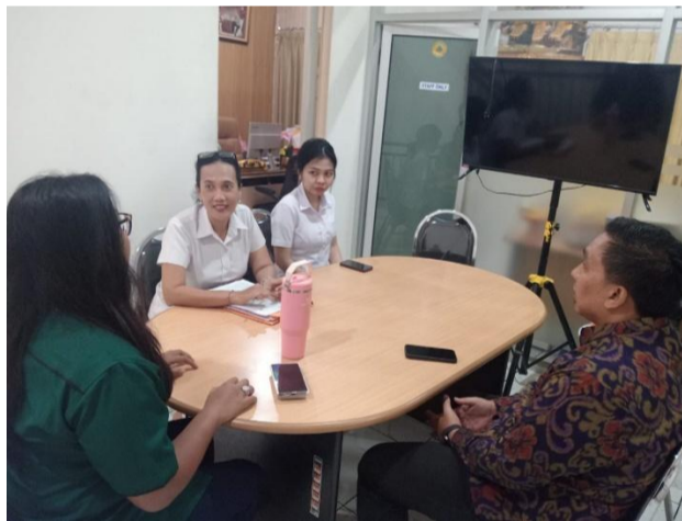
Dokumentasi dari Penyuluhan dan Pelayanan kepada Koperasi