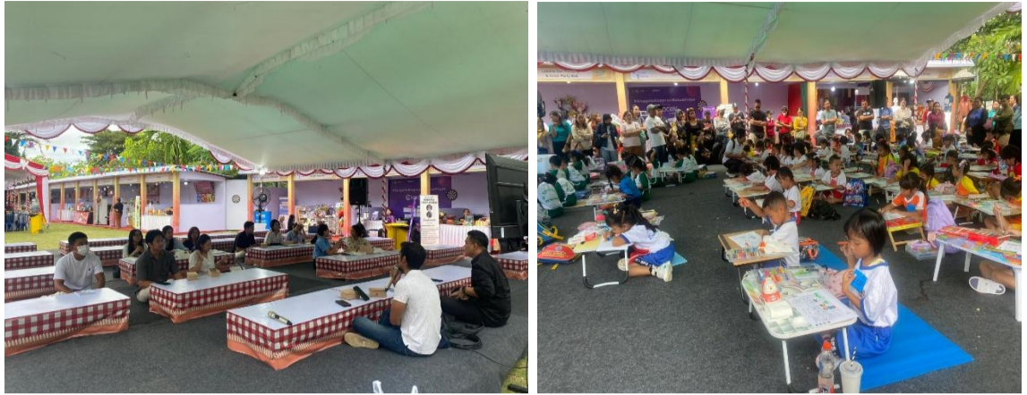
Dokumentasi kegiatan UMKM Festival