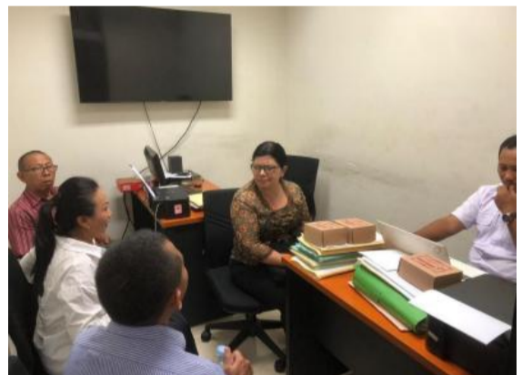
Dokumentasi pendampingan kasus dan panggilan kepolisian