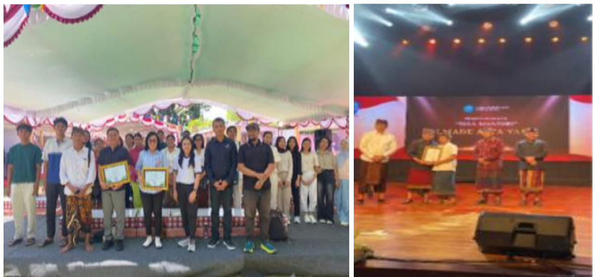
Dokumentasi Wirausaha Muda Festival