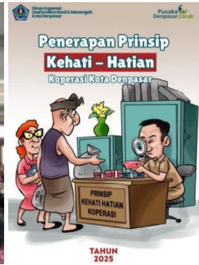
Dokumentasi Kegiatan Pendampingan Prinsip Kehati-Hatian