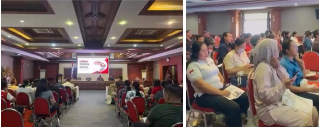
Dokumentasi Diklat Akuntansi Laporan Keuangan