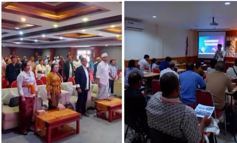
Dokumentasi Diklat Dasar-Dasar Perkoperasian

kegiatan Diklat Dasar-Dasar Perkoperasian yang bertujuan untuk memperkuat kelembagaan koperasi desa/kelurahan melalui peningkatan kapasitas SDM dalam memahami prinsip, nilai, dan tata kelola koperasi secara baik dan benar. Kegiatan Diklat berlangsung selama 4 hari dari tanggal 22 – 25 September 2025 bertempat di Kantor Kecamatan Setempat dengan jumlah peserta sebanyak 344 orang yang terdiri dari pengurus/pengelola Koperasi Desa Kelurahan Merah Putih Denpasar Utara, Denpasar Barat, Denpasar Selatan dan Denpasar Timur.