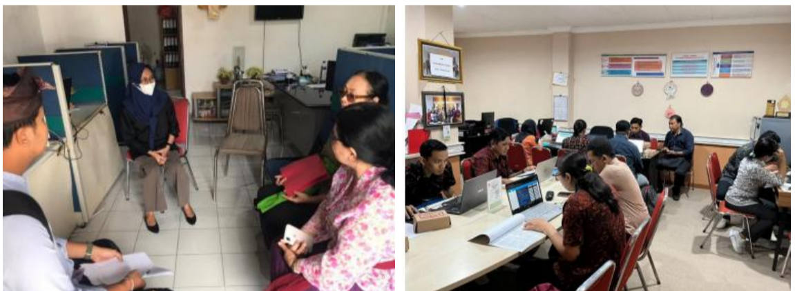
Dokumentasi Penilaian Kesehatan Koperasi

Dari 150 Koperasi yang dilakukan pemeriksaan kesehatan online, diketahui bahwa terdapat 7 koperasi dalam kategori dalam pengawasan, 95 koperasi kategori cukup sehat dan 48 koperasi dalam kategori sehat dengan catatan bahwasanya hasil penilaian kesehatan online yang tercantum dalam sertifikat penilaian kesehatan dapat diperbaiki jika terdapat informasi baru yang mempengaruhi hasil penilaian kesehatan.