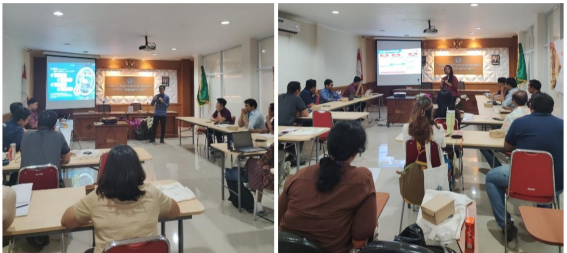
Dokumentasi Workshop Temu Bisnis

Adapun Workshop Temu Bisnis Tahun 2025 dibuka oleh Bapak Kepala Dinas Koperasi UMKM Kota Denpasar, selanjutnya materi berkaitan dengan Pasar Digital (PaDi) UMKM sebagai media pengadaan barang dan jasa perusahaan BUMN. Setelah itu diberikan materi penggunaan AI untuk produk UMKM dan dilanjutkan dengan materi berkaitan dengan penggunaan AI untuk kreatifitas produk UMKM. Di akhir acara ditutup oleh Bapak Kepala Bidang Pemberdayaan UMKM Dinas Koperasi UMKM Kota Denpasar.